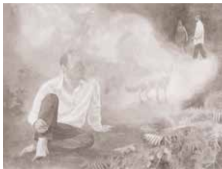
© Dominique Van den Bergh, « La renarde », lavés à l'encre de chine sur papier, 56x76 cm, 2019.

Une proposition de la Fondation Bolly-Charlier et partenariat avec OYOU (Clavier Marchin Modave Culture).