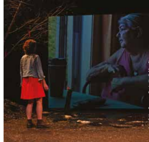
Appellation Sauvage Contrôlée

Vous versez alors un acompte de 15 € et le solde en 3 mensualités (novembre - décembre - janvier).