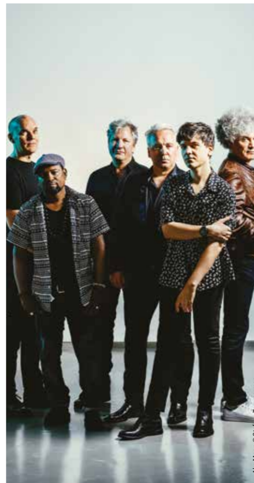
Aka Moon