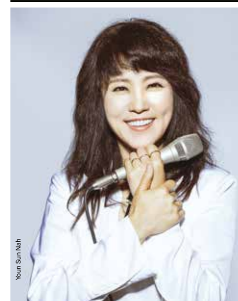
Youn Sun Nah