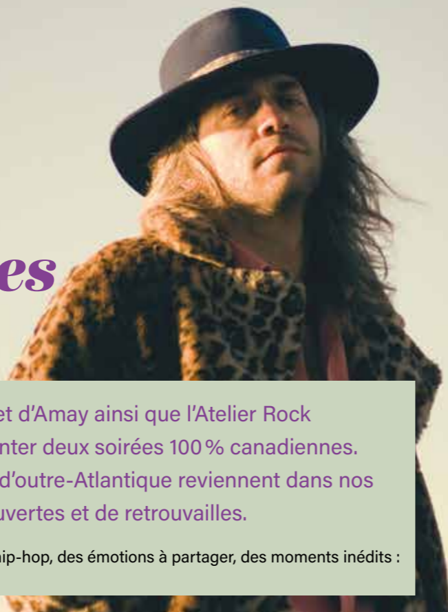
Corriveau © LePetitRusse

Du folk, du blues, du rock, des musiques « dites » du monde, du hip-hop, des émotions à partager, des moments inédits : ces Québecofolies 2022 s'annoncent passionnantes.