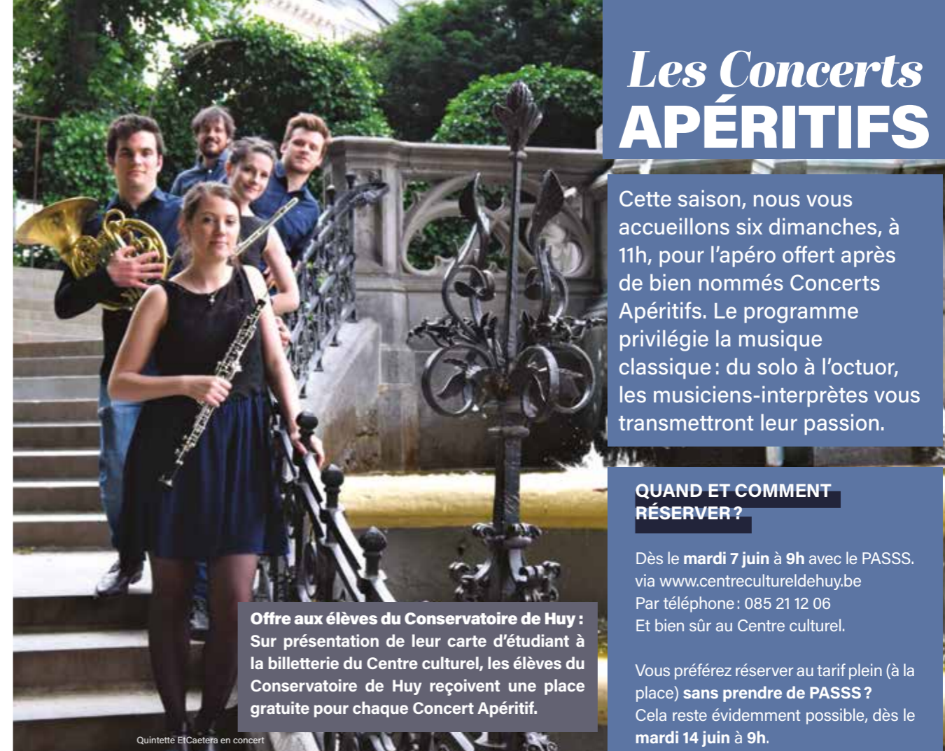
Quintette ElCaetera en concert

Plus d'informations sur le site www.centreculturelwanze.be