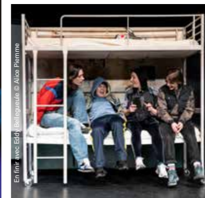
En finir avec Eddy Bellegueule © Alice Plemme

Duplex Cuisine et dépendances Antoine Hénaut Jack Cooper La Vraie Vie - Adeline Dieudonné Les Québecofolies Esteban Murillo Jeanne Kacenenbogen