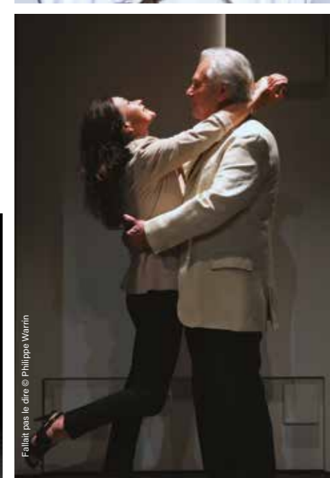
Fallait pas le dire