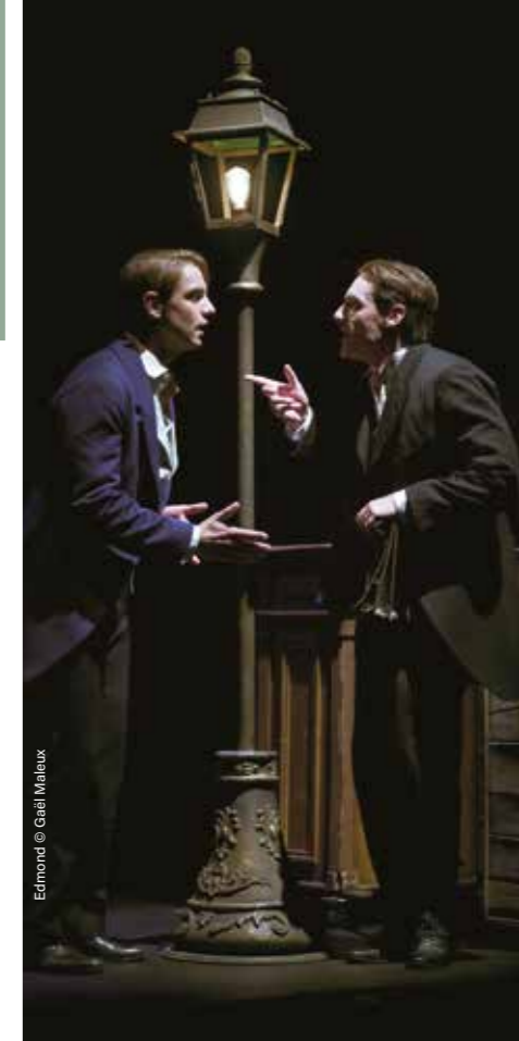
Edmond © Guéli Maleux