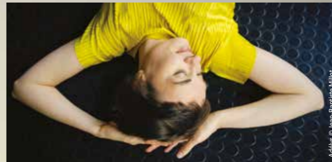
Adélys © Jean-Baptiste Millot