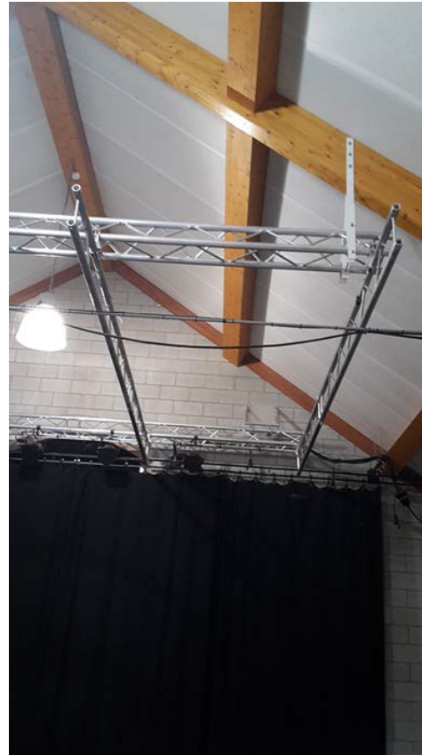
Pont partie cour