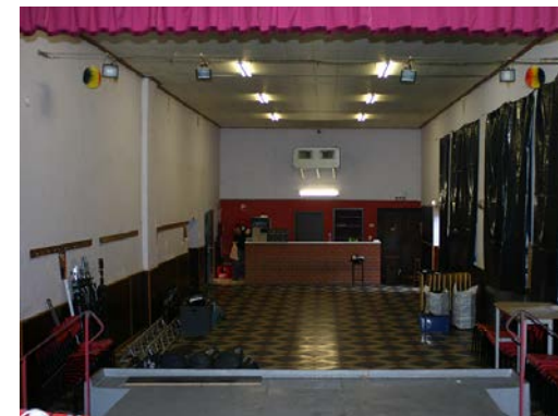
Salle + Scène