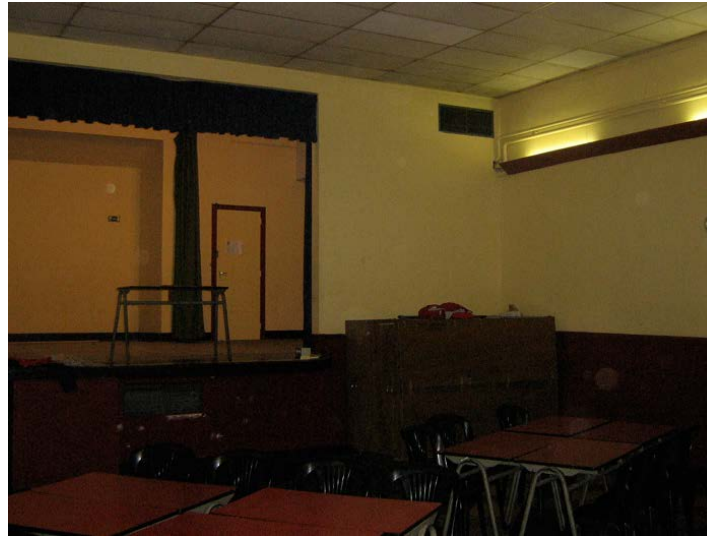
Tableau électrique scène