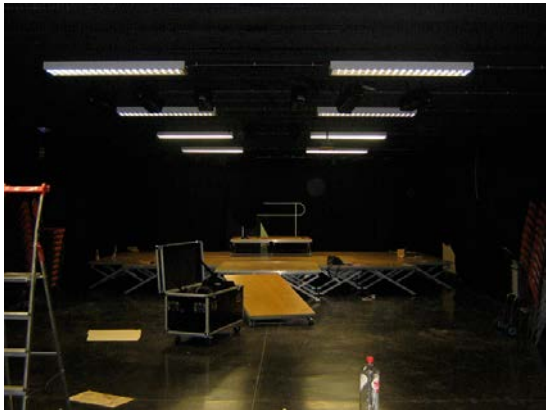
Salle – Scène - Gradin