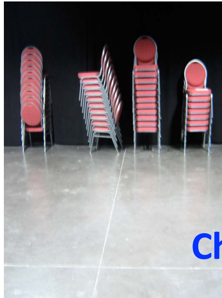
Chaises - Sol