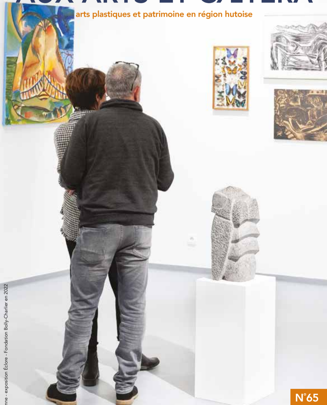
© Laurie-Anne - exposition Éclore - Fondation Bolly-Charlier en 2022

arts plastiques et patrimoine en région hutoise