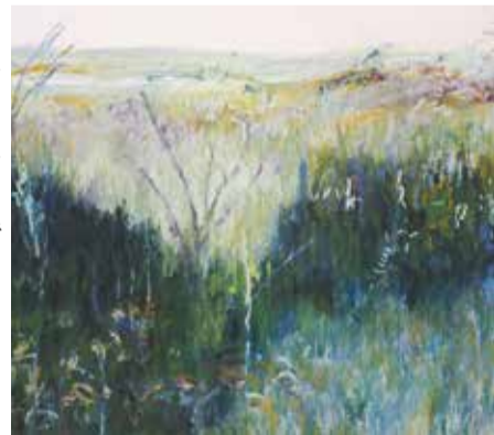
Chemin faisant © Jean-Paul Laixhay, Fin d'hiver, 115 x 150 cm, 2021

Il y a, dans certaines œuvres comme dans certains paysages, des choses que seuls la distance spatiale et le recul du temps sont à même de faire apparaître. Ainsi de quelques parcours aux ramifications multiples, de quelques travaux en apparence protéiformes, comme ceux de Jean-Paul Laixhay, qui vont de l'architecture à la peinture, de l'aménagement d'intérieur aux installations en extérieur, du dessin à la gravure ou autres techniques de reproduction. Au sein de cette diversité, la fin de sa trajectoire professionnelle principale – l'enseignement – semble le ramener, précisément, au cœur même du paysage et au geste qui entre tous lui importe : celui de peindre.