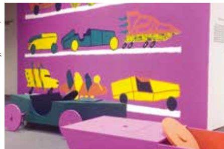
Chemin faisant © Jean-Paul Laixhay, Fin d'hiver, 115 x 150 cm, 2021

Cuistax : un terme spécifiquement belge pour désigner un véhicule typique du littoral qui évoque ludisme et bouffée d'air ! Le cuistax est aussi un engin qui nécessite une énergie de groupe pour avancer. C'est tout cela qui est insufflé à travers une exposition originale d'un collectif d'illustrateurs établi à Bruxelles qui a repris ce nom évocateur. Le collectif Cuistax imprime et auto-édite des images selon des procédés graphiques singuliers. Depuis sa création en 2013, il publie aussi un fameux fanzine bilingue pour enfants ciblant une thématique différente à chaque parution.