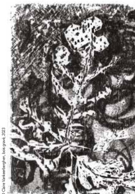
© Claire Vankeerberghen, bois gravé, 2023

Bienvue au vernissage de l'exposition de l'Atelier Gravure Où es-tu mon admirable?