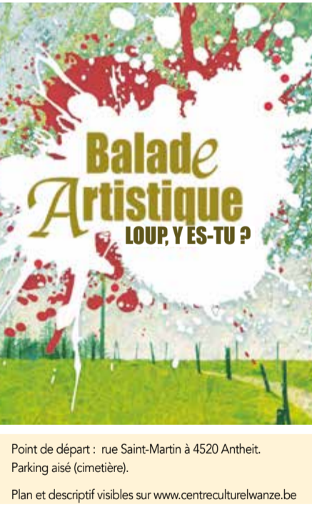
Point de départ : rue Saint-Martin à 4520 Antheit. Parking aisé (cimetière).