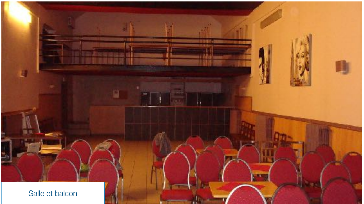
Salle et balcon