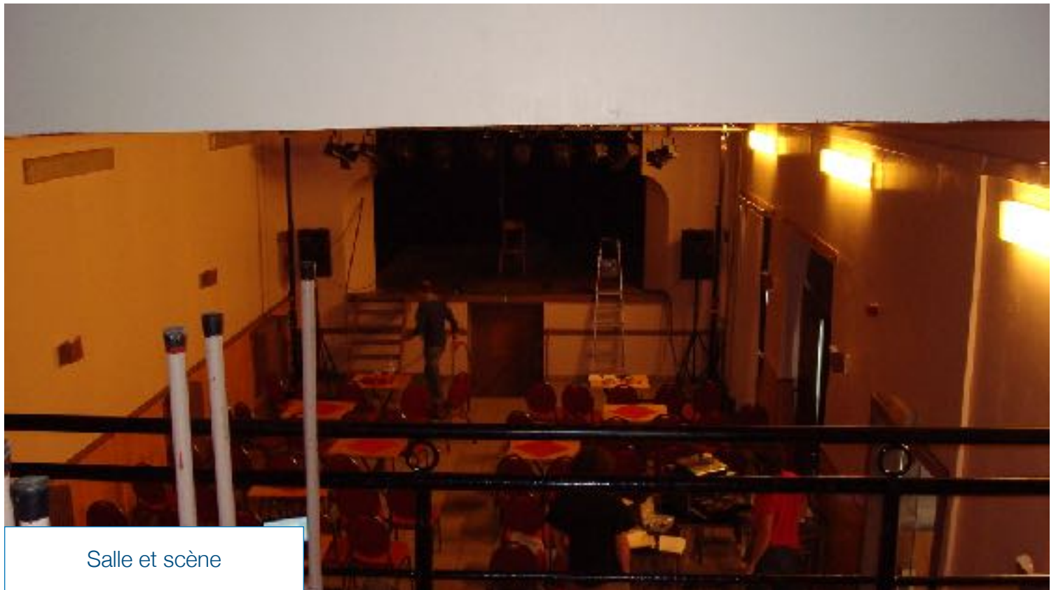
Salle et scène