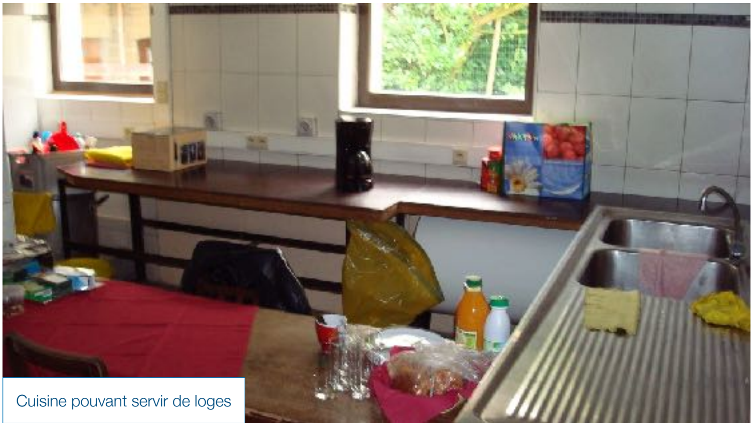
Cuisine pouvant servir de loges