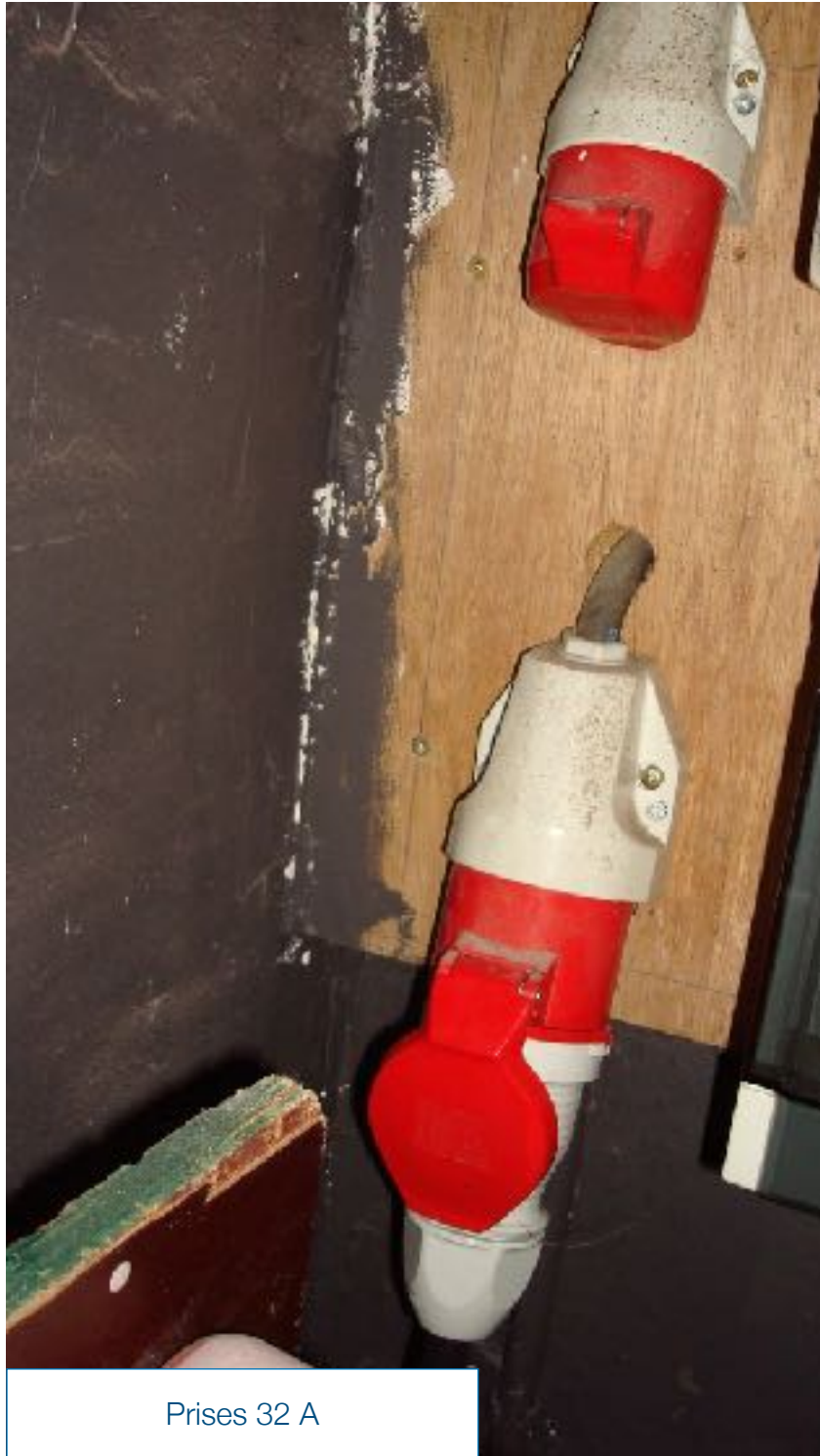
Prises 32 A