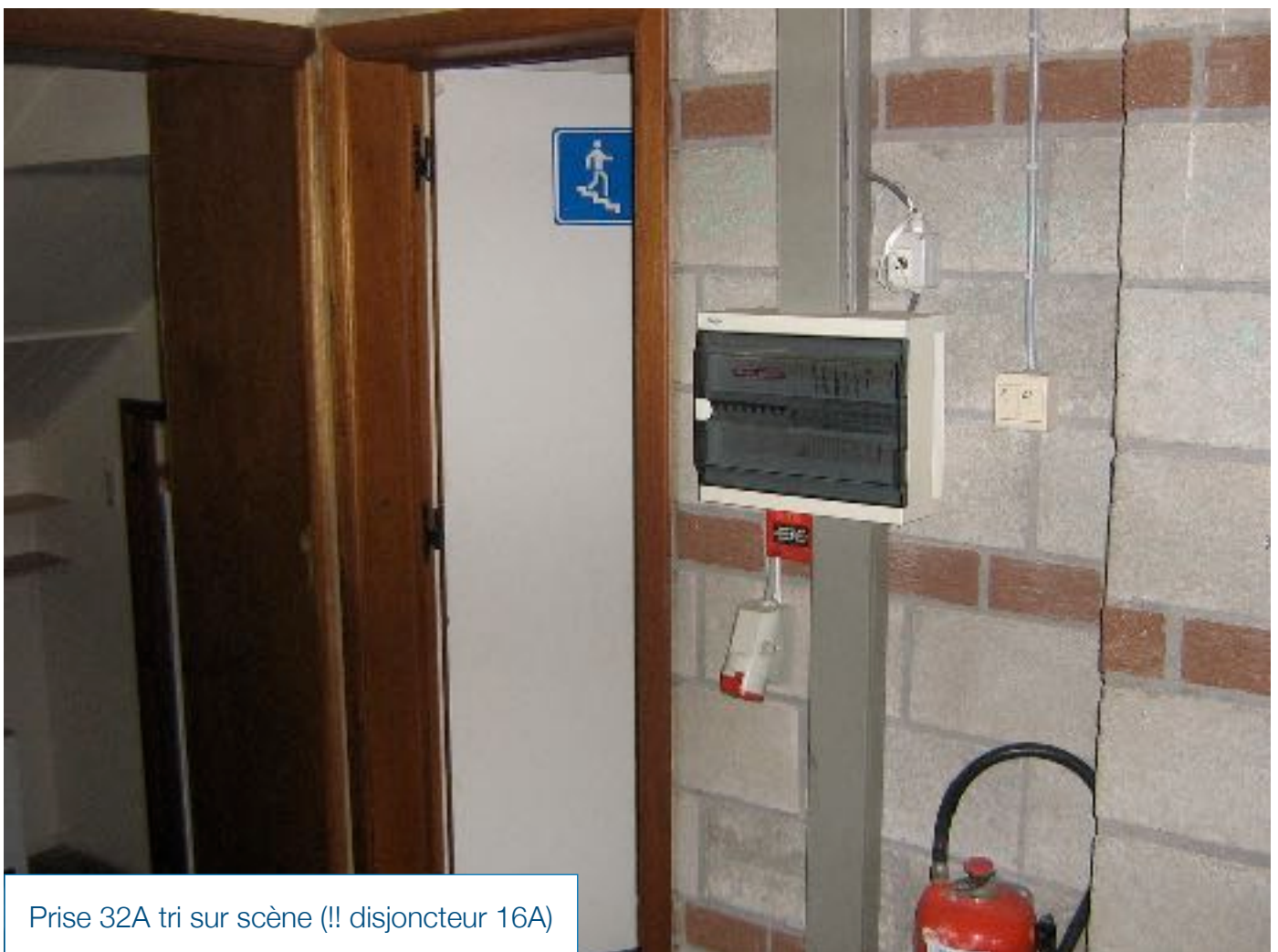
Prise 32A tri sur scène (!! disjoncteur 16A)