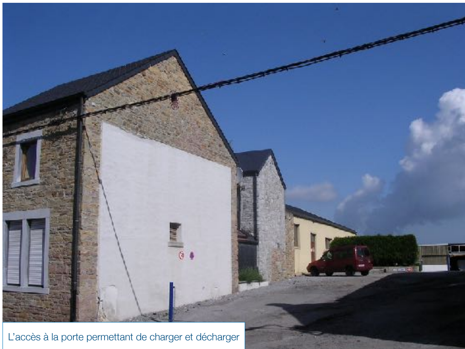
L'accès à la porte permettant de charger et décharger