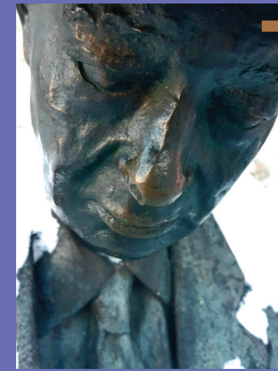
Le Lecteur de journal, 1992