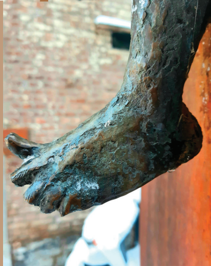
La Baigneuse, 2006

Les sujets de ses œuvres sont presque toujours des corps de femmes.