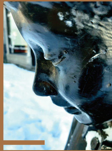
Les Joueurs de billes, 1992