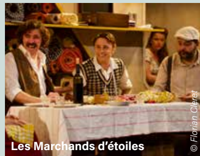
Les Marchands d'étoiles