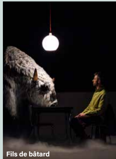
Fils de bâtard