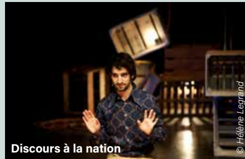
Discours à la nation