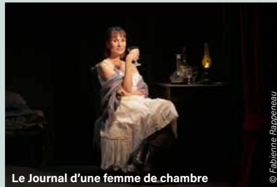
Le Journal d'une femme de chambre