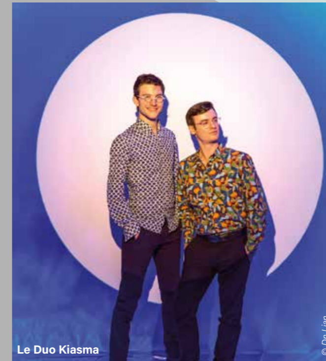
Le Duo Kiasma

Le programme Les 400 coups! 2025-2026 propose 9 rendez-vous avec la création scénique, le plus souvent le dimanche après-midi. Ces neuf spectacles sont à découvrir en famille. Tangram est conçu pour les petits dès 2 ans 1/2. Les grands enfants, âgés de 9 ans et plus, ne sont pas oubliés avec le concert « Films en musiques ». Entre les deux, créations théâtrales et spectacles musicaux raviront les jeunes spectateurs et leurs parents. On épingle déjà l'enthousiasmant « Ventre des sirènes », l'étonnant Glow ! , le nouvel opus d'André Borbé Le Grand possible , ou encore le sublime « Histoire de la fille qui ne voulait pas être un chien ».