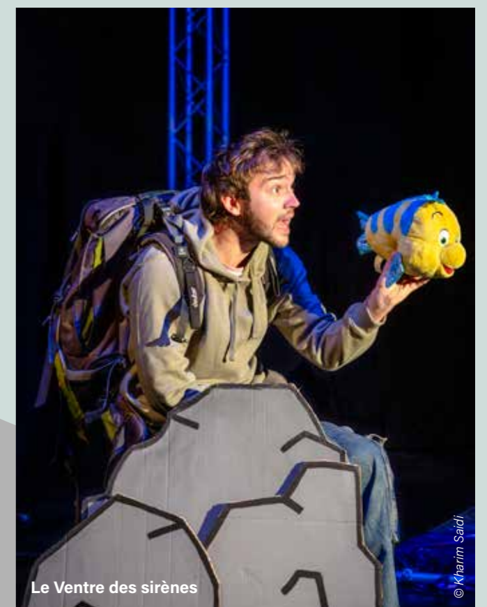
Le Ventre des sirènes

À l'affiche des Concerts Apéritifs 2025-2026, encore et toujours de la musique de chambre (mais pas que!). Le jeune Quatuor Légia et l'étonnant Duo Kiasma sont, entre autres, au programme. Et aussi, pour cette nouvelle saison, une carte blanche aux professeurs du Conservatoire de Huy et l'irrésistible concert Kiki à Paris . Sans oublier le traditionnel apéritif offert en fin de concert, en présence des musicien-ne-s.